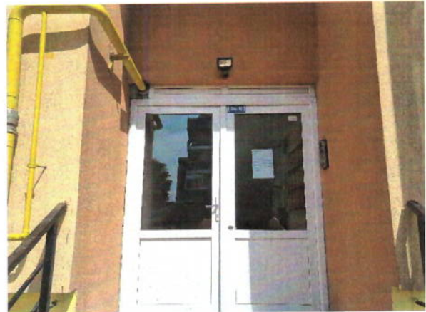
Acces imobil apartinator