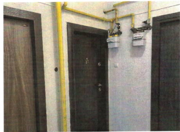
Vedere usa acces apartament