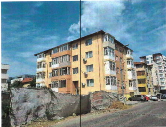
Vedere generala imobil apartinator