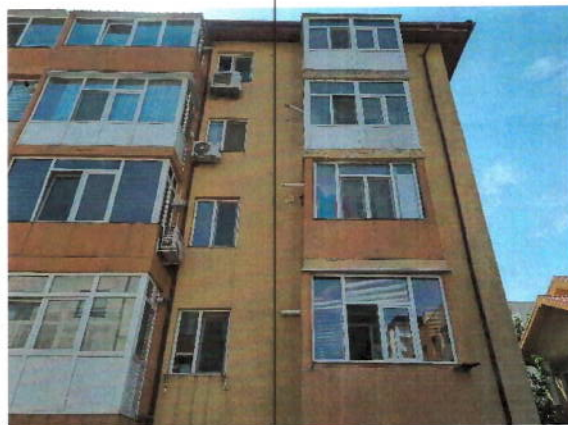
Vedere exteriorara apartament