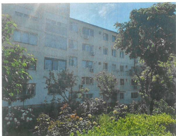
Vedere generala imobil apartinator