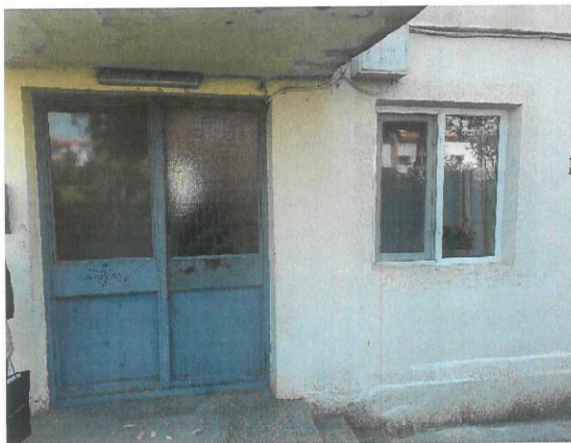
Vedere acces scara B