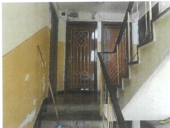
Vedere casa scarii etaj 2