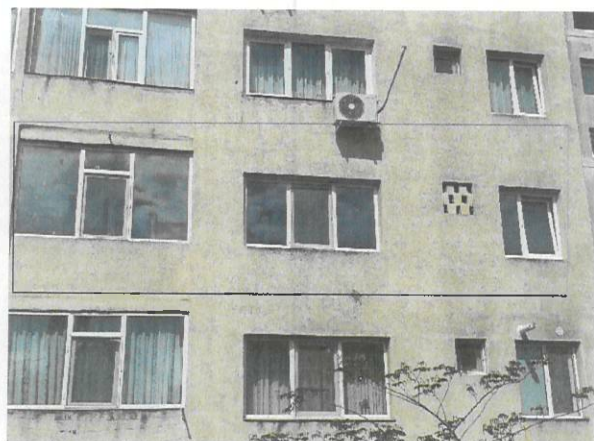
Vedere exteriora proprietate