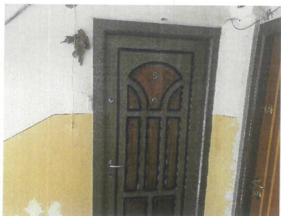
Vedere usa acces apartament