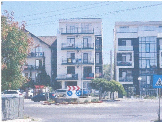
Vedere generala ( din Bd Mamaia Nord )