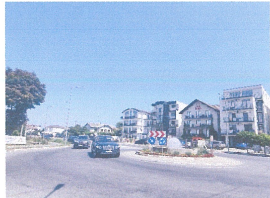
Vedere cale de acces si vecinatati