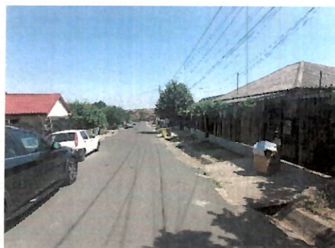
Vedere generala cale acces si vecinatati