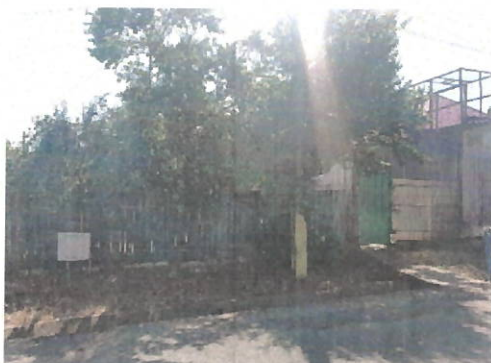
Vedere generala imobil