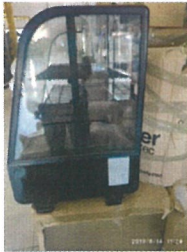
Vitrină refrigerare de banc TVK 100S