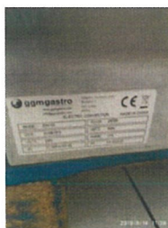
Cuptor patiserie ENK 100 Serie nr. CO11508010-YXD-1AE