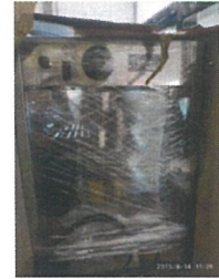
Vitrină caldă de banc WHK3