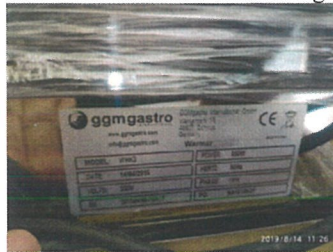
Vitrină caldă de banc WHK3