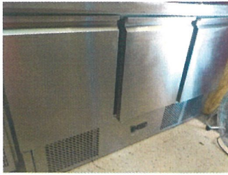
Masă frigorifică refrigerare SAS147E