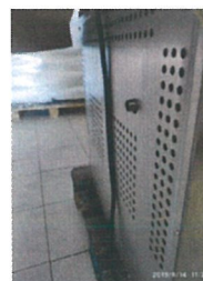
Cuptor patiserie ENK 100 Serie nr. CO11508067-YXD-1AE