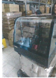
Vitrină refrigerare de banc TVK 100S