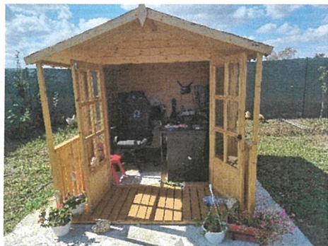
CASUTA TIP BIROU, NR. INV. 3