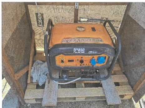
GENERATOR GT 15000E-A, 8 KW, NR. IN'