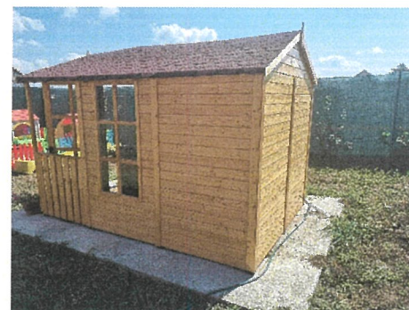
CASUTA TIP BIROU NR. INV. 3